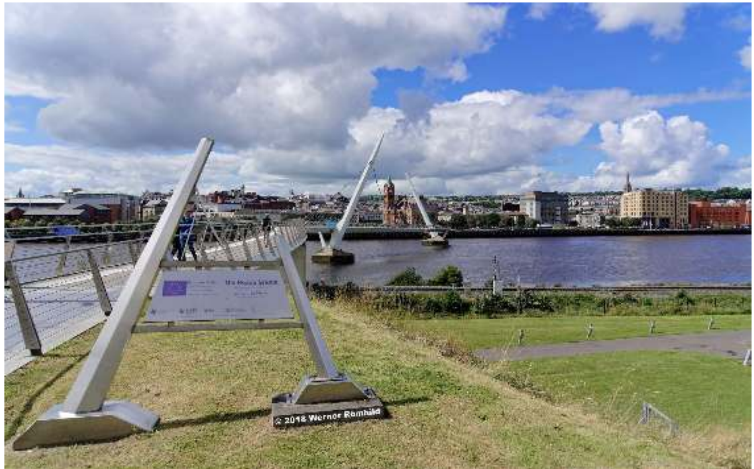
Peace Bridge, Derry, Co. Derry, Northern Ireland, © 2018 Werner Röhild

Peace Bridge, Derry, Co. Derry, Nordirland